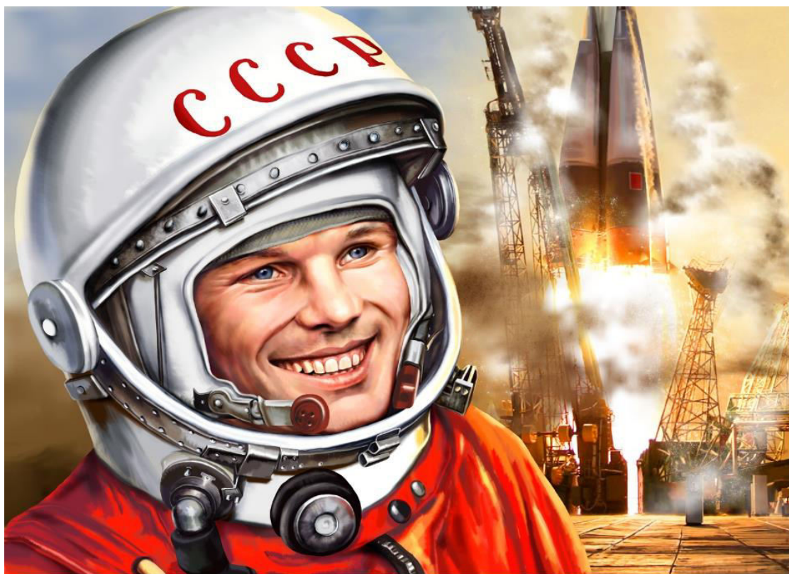
Фото на презентации.

Кто был первым космонавтом? (Юрий Гагарин) ответы детей.